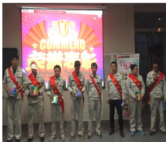
创意功夫员工颁奖